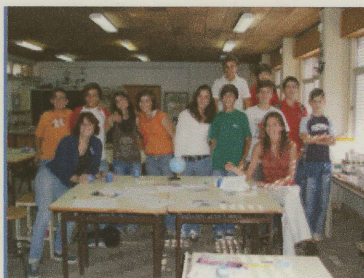
Atelier de pintura